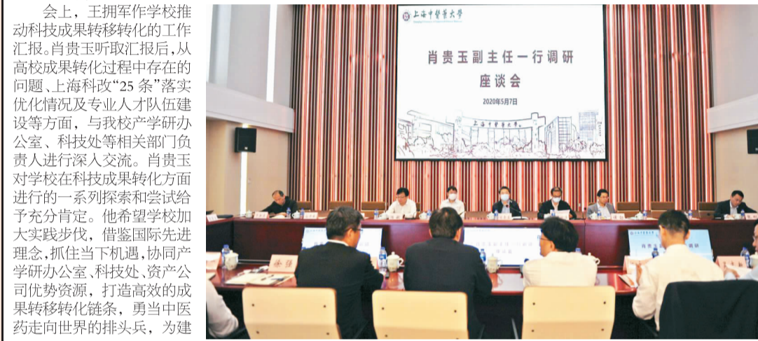
肖贵玉副主任一行调研座谈会

本报讯 5月7日下午,上海市人大常委会副主任肖贵玉一行来我校调研上海科改“25条”落实优化、高新区和科创承载区建设等工作情况(如图)。市人大常委会副主任委员吴祖强,上海科创办执行副主任彭崧,市科委总工程师陆敏、政体处处长方浩、战略规划处处长孙中峰等陪同调研。我校党委书记曹锡康,校长徐建光,副校长杨永清、王拥军,相关职能部门及协同创新中心负责人参加调研座谈会。