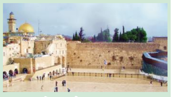
银杏苑 雨中哭墙

全书基本观点:认为临床实践经验是中医学术发生的基石,巫祝医学是孕育中医学的文化摇篮,根植于先秦天文学说及气象发生学的气气阴阳五行六气学说是中医学的思想灵魂,脏腑理论、命门三焦理论、伤寒六经理论、经络理论、气血津液理论等皆是天人合一思想下的元气阴阳五行学说产物。本书综合运用逻辑、文献、考古、训诂等研究方法,以神学、甲骨学、天文学说、气象历法学、易学、理学、神话学等知识背景为基础,详细解读了数千年前中医学学术思想发生形成的过程,揭示演绎了中医学一系列临床理论实践体系的内涵本质及精髓所在。