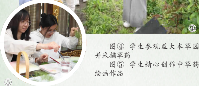
图④ 学生参观益大本草园并采摘草药 图⑤ 学生精心创作中草药绘画作品