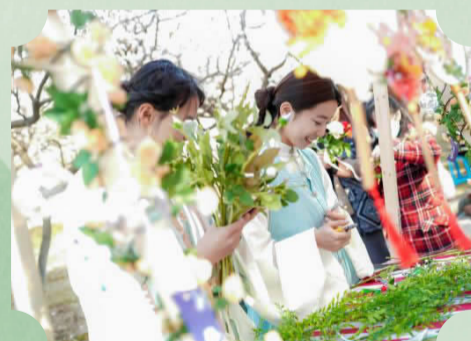
杏林古韵游园会组图

着古装,秀才艺,一场中华古典美学盛宴在校内开启。杏林古韵游园会上,沪上20多所高校学生代表在杏林步道边支起摊子,通过茶饮、茶艺、中华射艺、扎染、香囊制作、闻香识本草等传统文化实践体验,加深同学们对中华优秀传统文化的理解和感悟。(团委)