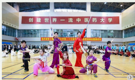
图① 八段锦为首个赛项,现场上百人同练八段锦 图②③ 武术、散打、短兵等体育教学项目轮番展示