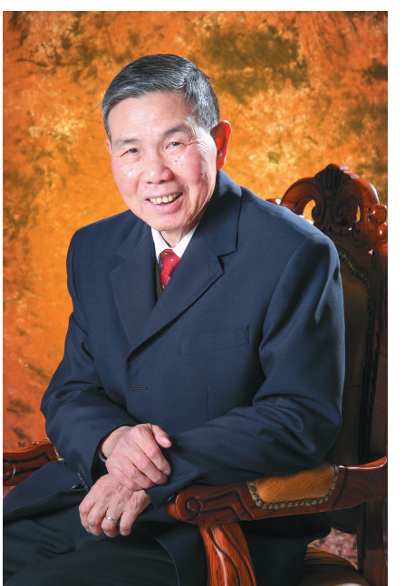
刘嘉湘，国医大师，1934年出生于福建省福州市，1949年开始从医，1955年加入中国共产党，为我校终身教授、博士生导师和附属龙华医院终身教授、主任医师，首届上海市名中医，第三、四、五、六批全国中医药专家学术经验继承工作指导老师，享受国务院政府特殊津贴专家，国家中医临床研究基地（恶性肿瘤）首席专家，世界中医药学会联合会肿瘤专业委员会副会长。

1960年，上海中医学院响应卫生部号召，培养中医专业接班人，决定从首届在读学生中选拔品学兼优、政治过硬的学生作为定向师资重点培养，刘嘉湘等3名学生党员脱颖而出，被选中调入中医内科教研组，参与备课、听课与辅导工作，并参加第一版全国中医内科学统一教材的编写和审稿会。同年，他们还受学校派遣到上海市第十人民医院（曙光医院前身）学习，当时学校党委书记林其英要求他们在半年内基本继承张伯乐的学术思想和临床经验。在跟诊张伯史期间，他们白天抄方，晚上查找资料，分门别类整理病证、脉象、药方，记录跟诊体会。同时还要阅读老师们推荐的书籍。因此，他们的内科诊疗思路受张伯史影响最深。